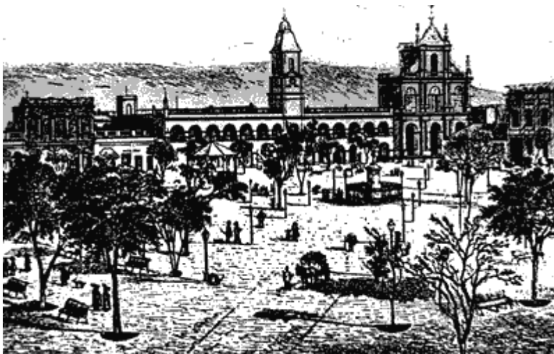
Antiguo grabado que representa la Plaza Mayor de San Miguel de Tucumán.

Después de la revolución de mayo de 1810 y con el comienzo de las guerras de la independencia, la tranquila vida tucumana se alteró completamente. En 1812 se libró una batalla en las afueras de la ciudad, muy cerquita: la batalla de Tucumán. Durante los años siguientes se respiraba en el aire el olor a pólvora y todos temían un nuevo ataque del enemigo. Por ese motivo, a las diez de la noche había que suspender las actividades: no se podía circular por las calles, ni tampoco dejar ninguna lámpara encendida. A las diez en punto, Tucumán quedaba a oscuras.